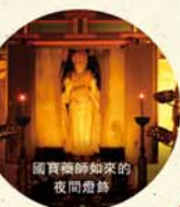
國寶藥師如來的夜間燈飾