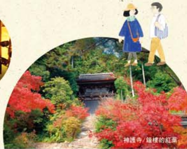
神護寺/鐘樓的紅葉